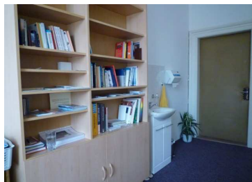
Ilustrační foto – pracovnice, uživatelé a aktuálně rozšířené zázemí Charitní ošetrovatelské služby Náchod, Charitní pečovatelské služby Náchod.